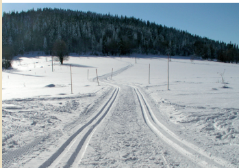
▲ Stopa na České Žleby

BOROVÁ LADA Obec Borová Lada, tel.: 388 434 135, e-mail: borovalada@sumavanet.cz, www.borova-lada.cz ■ Penzion Na Radnici, tel.: 728 418 989 ■ Penzion Borůvka, tel.: 728 418 989