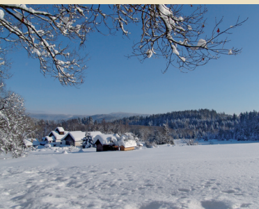
▲ Salzerův mlýn v Rásnici