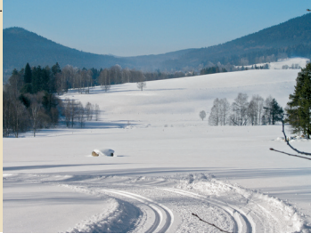
▼ Stopa na Strážný

Za aktuálnost údajů odpovídají jednotlivé obce.